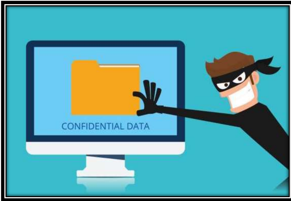
Protección de la propiedad